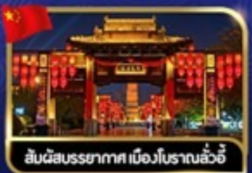
สิมฉัสมรธาาศ เมืองโบราณลั่วอี้