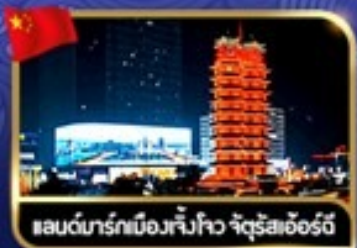
แลนด์มาร์กเมืองเจ็โจว จัตุรัสเอ๋อริ้ว

พิเศษ!!! เที่ยวเทศกาลดอกโบตั๋น & ชมโชว์กังฟูเส้าหลิน