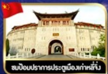
ชมป้อมปราการประตูเมืองเก่าหลี่จิ้ง