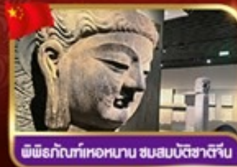
พิพิธภัณฑ์หอหนาน ชมสมบัติชาติจีน