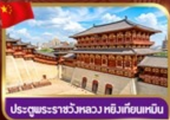
พระราชวังหลวง หอเทียนเหมิน

พิเศษ!!! เที่ยวเทศกาลดอกไม้ต้น & ชมโชว์กังฟูล้ำหลิม