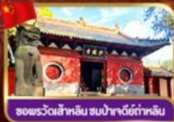
ซอพรวัดสำหลิม ชมปาชาดีย์กำหลิม