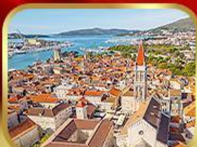
มหาวิหารเซนต์โลว์เรนซ์