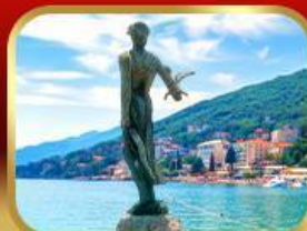
ราชินีแห่งอาเดรียติก โอฟาเทีย