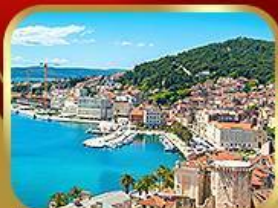
ชมย่านเมืองเก่าสปลิก