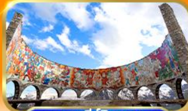
อนุสาวรีย์มิตรภาพ รัสเซีย-จอร์เจีย