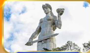
อนุสาวรีย์พระเจ้าจอร์เจีย