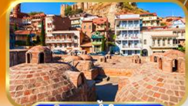
โรงอบน้ำโบราณ อะบาโนตุนานี

อ่าวเก็บน้ำซินวรี•มหาวิหารไอลิกินีตี•สะพานสันติภาพ•นั่งกระเช้าป้อมนาริกาลา ชมวิวทิวทัศน์•East Point Mall