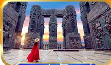
อุทยานประวัติศาสตร์ จอร์เจีย