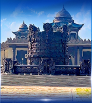
ศูนย์วัฒนธรรม มองโกเลีย หยวนหลิว