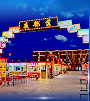
ตลาดกลางคืน ตาลาเดอวี