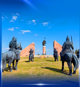
สวนสาธารณะหงกิลง่าน