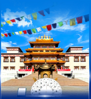
วัดพระโพธิสัตว์ อูลาน