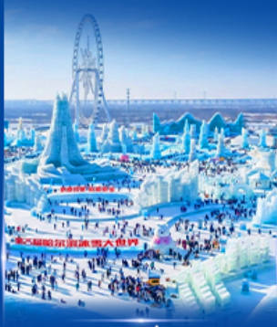
เทศกาลหิมะและน้ำแข็ง 2027