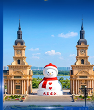
ตึกตาสีงักซี ฮาร์ฮิน