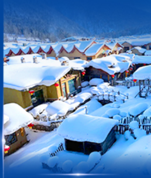
หมู่บ้านหิมะ สโนว์ทาวน์