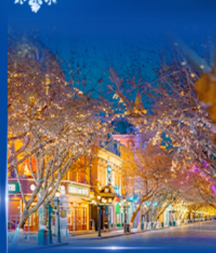
ย่านจงหยาง สตรีท