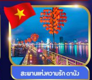
สะพานแห่งความรัก ดานัง