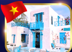
คาเฟ่สไตล์ชาโตริบี่ ซันทรา มาริน่า