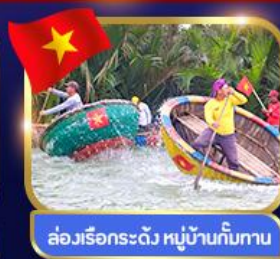
ล่องเรือกระดิว หมู่บ้านกัมกาน