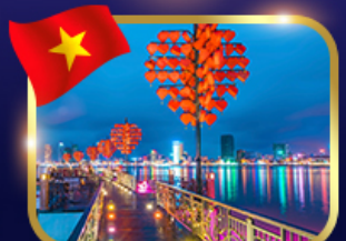
สะพานแห่งความรัก ดานัง