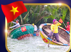
ล่องเรือกระด้ง หมู่บ้านก๊อทาน