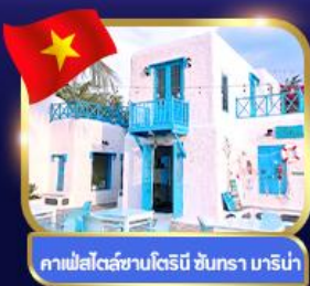
คาเฟ่สไตล์ซานโตรินี่ ชันทรา มาริน่า