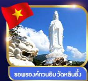
ขอพรองค์กวนอิม วัดหลินอ๋อง