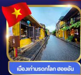
เมืองเก่ามรดกโลก ฮอยอัน