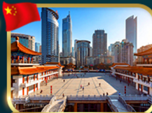
เข็คอินตึกไคว่ซังโหล