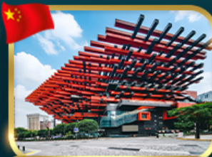
แลนด์มาร์กจั๊ว ตึกตะเกียบ