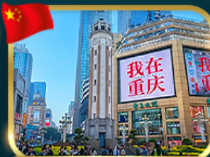
ถนนคนเดินเจียงฟางเป่ย์