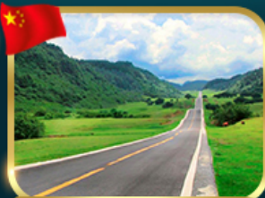
ชมวิวยุทยานเขานางฟ้า