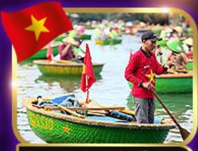
เรือกระด้ง หมู่บ้านกิมทาน