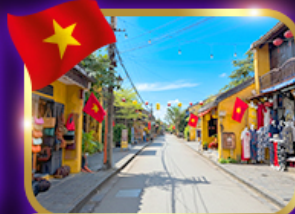
เมืองเก่ามรดกโลก ฮอยอัน