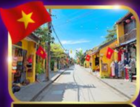
เมืองเก่ามรดกโลก ฮอยอัน