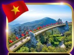
สะพานมือสีทอง บานาฮิลล์