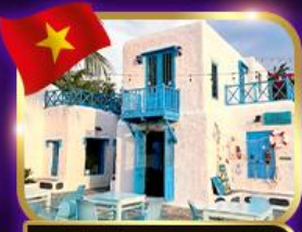
คาเฟ่สุดชิค ซานทรา มาริน่า