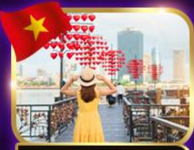
เช็คอินสะพานแห่งความรัก