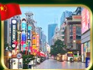
ถนนคนเดินหนานจิง