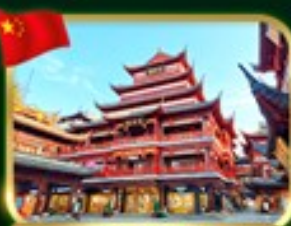
ตลาดร้อยปี เจิวหวังเมี่ยว