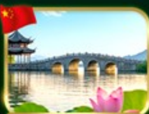
เที่ยวชมวิวกะหลาซานซีหู