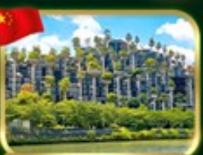
อาคาร 1,000 trees