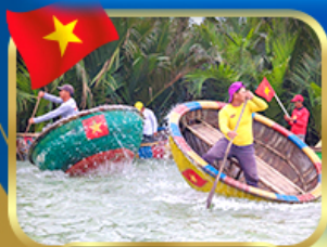
ล่องเรือกระดี่