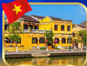
เมืองเก่าฮอยอัน