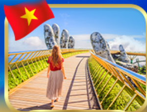
สะพานมือทองคำ