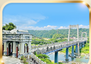
สะพานต้าซี เกาหลีหวาน