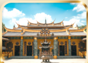
วัดต้าซี ซอกความรวย