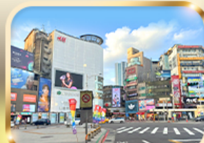
ช้อปปิ้งย่านซีเหมินติง