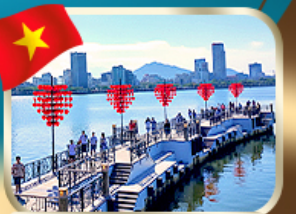
เช็คอินสะพานแห่งความรัก ดานัง