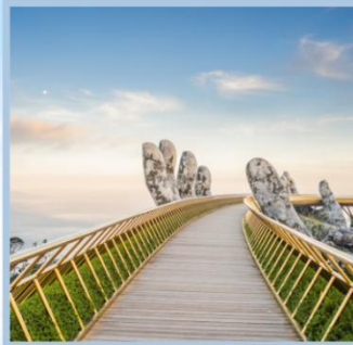
สะพานมือทองคำ