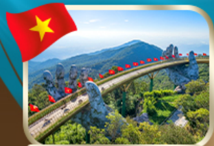
เที่ยวสะพานบ็อกงคัม บานาฮิลล์

ค่าจ้างไกด์และคนขับรถท้องถิ่น 1,000 เก็บที่สนามบิน รวมแล้วเริ่ม 12,888 ถูกที่สุดแน่นอน