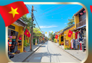
เที่ยวชมเมืองเก่ามรดกโลก ฮอยอัน