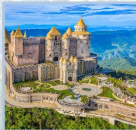
ปราสาทจันทร