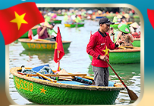
ล่องเรือกระด้ง ชมหมู่บ้านกัททัน