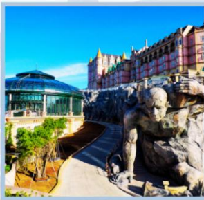
โซน Eclipse Square