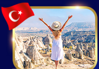
หุบเขาแห่งรัก คัมปาโตเกีย