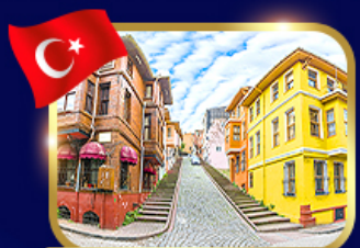
ชมบ้านหลากสี ย่านบาลีก