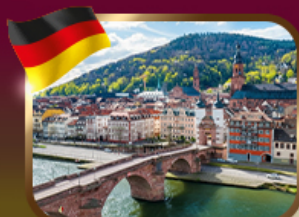
เมืองโรเมนติกไฮเดลเบิร์ก