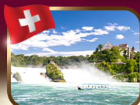
ชมน้ำตกโรนใหญ่ที่สุดในยุโรป