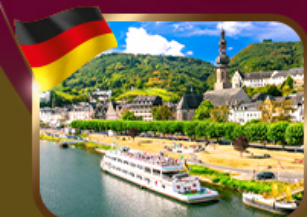
ล่องเรือ น็อบบาร์ด - ชิวทอร์