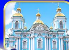
โบสถ์นิโคลัสออโรดิอิกซ์