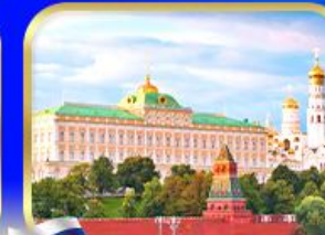
ชมพระราชวังเครมลิน