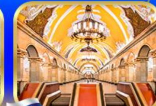
สถานีรถไฟใต้ดินมอสโก

พิพิธภัณฑ์เฮอร์มิเทจ • พระราชวังปีเตอร์ฮอฟ • ป้อมปีเตอร์แอนด์ปอล • นั้รกดไฟ SAPSAN 1 ชา • จัตุรัสแดง • มหาวิหารเซนต์บาซิล • อีสมายลอฟสกี