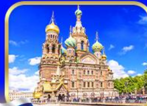
โบสถ์แห่งหยดเลือด