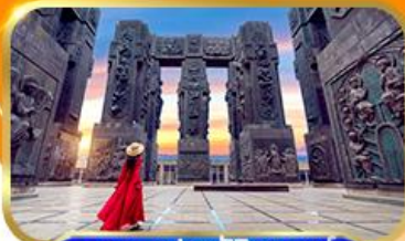
อุทยานประวัติศาสตร์ จอร์เจีย