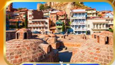
โรงอบน้ำโบราณ อะบาโนตุนานี

อ่าวเก็บน้ำซินวรี•มหาวิหารไอลิกินีตี•สะพานสันติภาพ•นั่งกระเช้าป้อมนาริกาลา ชมวิวทิวทัศน์•East Point Mall