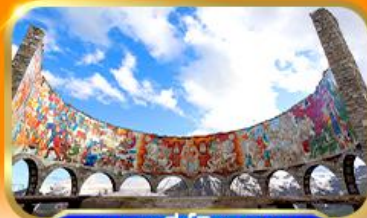
อนุสาวรีย์มิตรภาพ รัสเซีย-จอร์เจีย