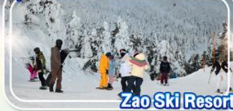
Zao Ski Resort