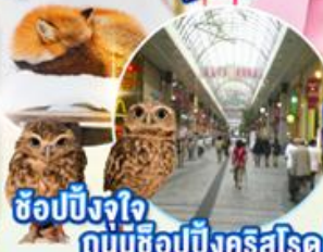
ช้อปปิ้งใจ ถนัมช้อปปิ้งคริสต์โรด

ไฮไลท์!! สัมผัสความงามของแหล่งออนเซ็นชื่อดัง กินช้อนออนเซ็น ลานกิจกรรม ณ ซาโอ: ออนเซน สกีรีสอร์ท พื้นที่สนุกกับหิมะ-กิจกรรมกลางแจ้ง ชมความน่ารักของน้องจิ้งจอกที่ หมู่บ้านจิ้งจอกญี่ปุ่น ภูเขาซาโอ: หมู่บ้านโออูจิ จุก หมู่บ้านโบราณสมัยเอโดะที่ยังคงเสน่ห์ดั้งเดิม ช้อปปิ้งจุก ณ เมืองเซนไดที่ ถนนช้อปปิ้งคริสต์โรด