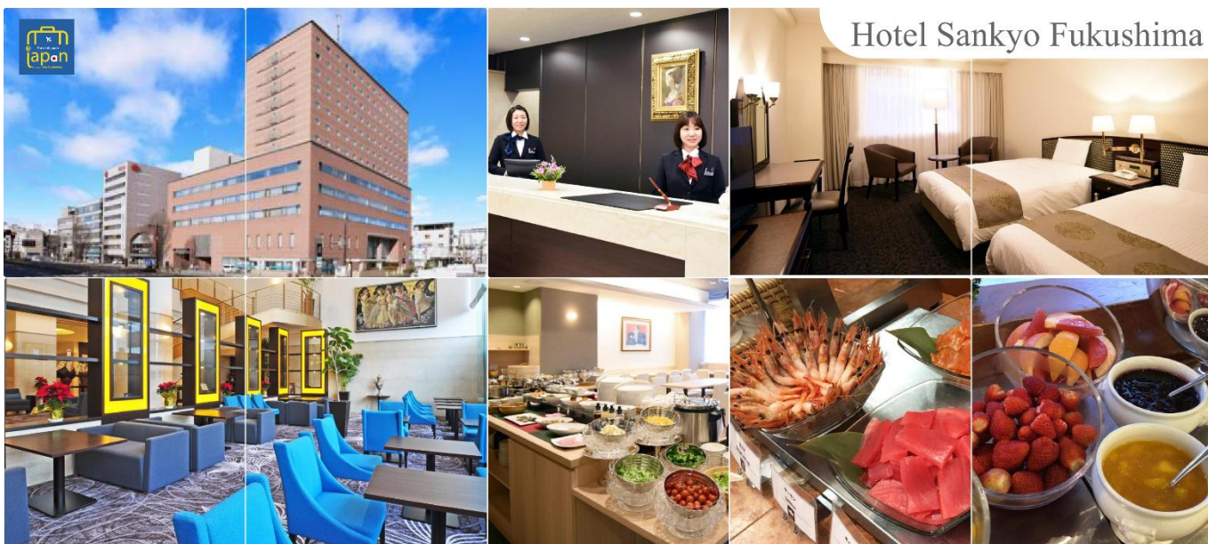
Hotel Sankyo Fukushima

พักที่ HOTEL SANKYO FUKUSHIMA หรือเทียบเท่าระดับเดียวกัน