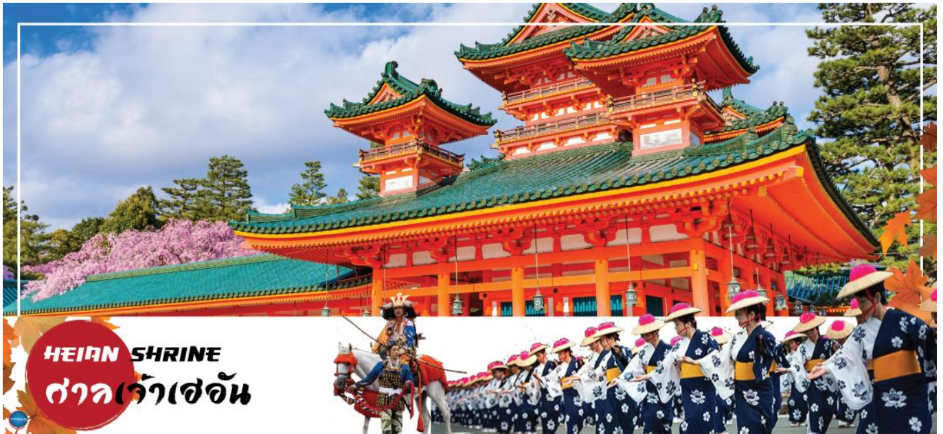
HEIAN SHRINE ศาลเจ้าเฮอัน

วันที่ห้า เมืองนาโกย่า – เมืองเกียวโต – ศาลเจ้าเฮอัน – การเรียนพิธีชงชาญี่ปุ่น – เมืองโอซาก้า – ศาลเจ้านัมมะยะซากะ – ช้อปปิ้งชินไซบาชิ