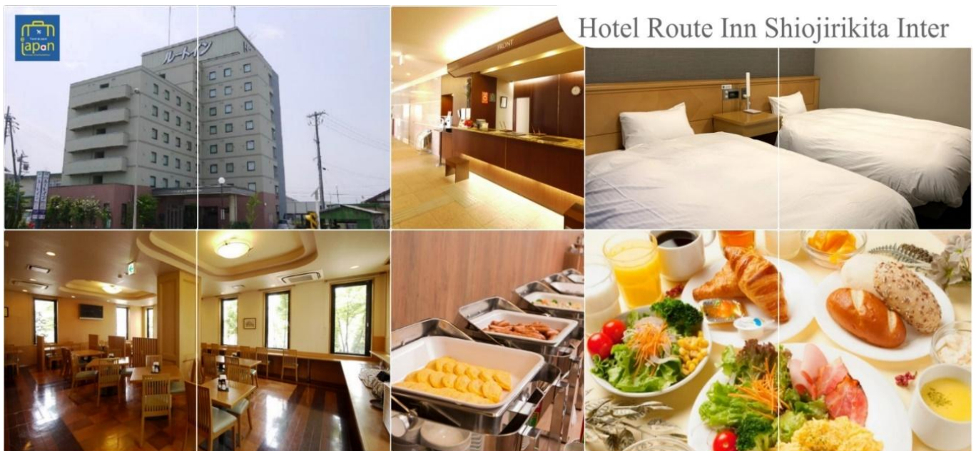
Hotel Route Inn Shiojirikita Inter

พักที่ HOTEL ROUTE-INN SHIOJIRIKITA INTER, MATSUMOTO หรือเทียบเท่าระดับเดียวกัน