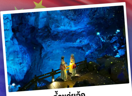
ถ้ำลู่อ้อ

"ดินแดนแห่งสายน้ำและภูเขา" สัมผัสประสบการณ์นั่งบอลลูนชมวิวมุมสูง