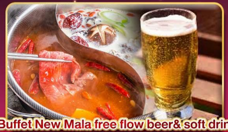
*Buffet New Mala free flow beer& soft drink