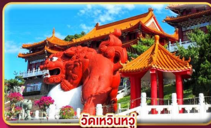
วัดเหวินทวี่