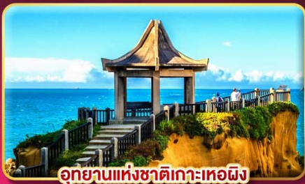
อุทยานแห่งชาติเกาะเหอผิง

ชมพลุข้ามปี ฉลองเทศกาลปีใหม่ 2027 แช่น้ำแร่ส่วนตัวในห้องพัก