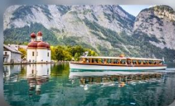
ทะเลสาบคอนิกซ์