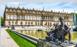
พระราชวัง Herrenchiemsee