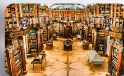
หอสมุดมรดกโลก St.Gallen