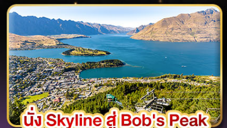
นั่ง Skyline สู่ Bob's Peak