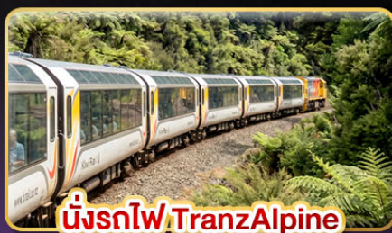
นั่งรถไฟ TranzAlpine