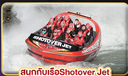
สนุกกับเรือ Shotover Jet