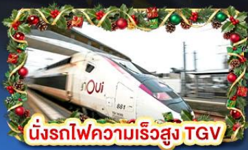
นั้รรถไฟความเร็วสูง TGV