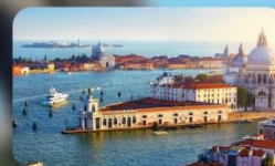
ชมความงามเมืองเวนิส