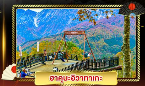
ฮาคุบะฮิวาตากะ