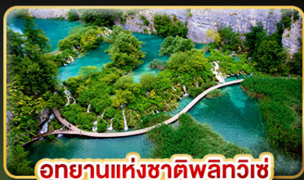
อุทยานแห่งชาติพลิตวิเช่