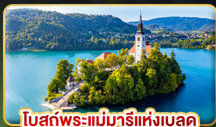
โบสถ์พระแม่มาเรียแห่งเบลด