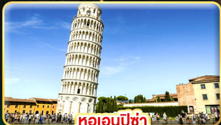
หออนปีซ่า