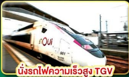
นั่งรถไฟความเร็วสูง TGV

📅 เดินทาง: 08-16 ส.ค. / 26 ก.ย. - 04 ต.ค.69