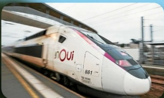
นั่งรถไฟความเร็วสูง TGV