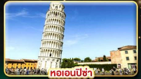
หออนปซ่า