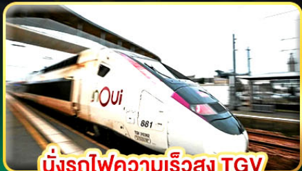
นั่งรถไฟความเร็วสูง TGV

📅 เดินทาง: 08-16 ส.ค. / 26 ก.ย. - 04 ต.ค.69