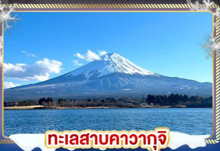
ทะเลสาบคาวากุจิ