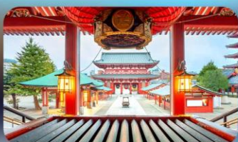
วัดเซ็นโซจิ

HOTEL HEDISTAR NARITA หรือเทียบเท่ามาตรฐานญี่ปุ่น