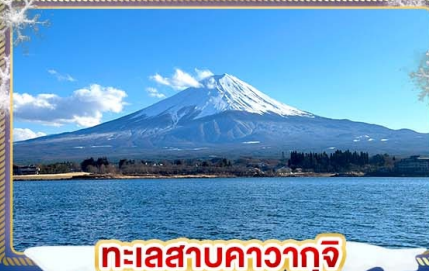
ทะเลสาบคาวากุจิ