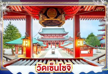
วัดเซ็นโซจิ

เที่ยวชมงานประดับไฟฤดูหนาว SAGAMIKO ILLUMINATION เช็กอินลานสกี ชมวิวภูเขาไฟฟูจิ