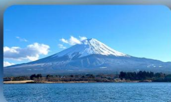
ทะเลสาบคาวากุจิ