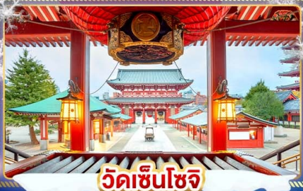
วัดเซ็นโซจิ