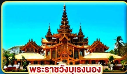
พระราชวังบุเรงนอง