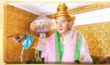
เทพทันใจ