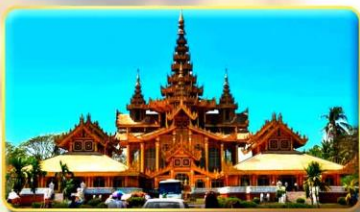
พระราชวังบุเรงนอง