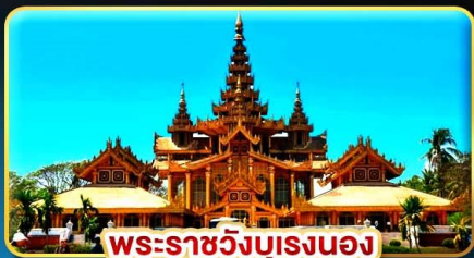
พระราชวังบุเรงนอง