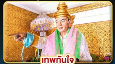
เทพทันใจ