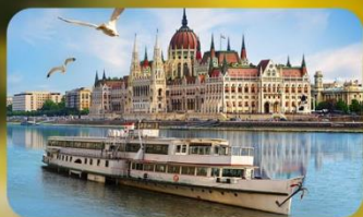
ล่องเรือแม่น้ำดานูบ พร้อมจิบแชมเปญ