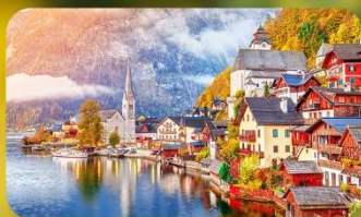
การันตีพัก Hallstatt / St. Wolfgang หรือริมทะเลสาบ 1 คืน