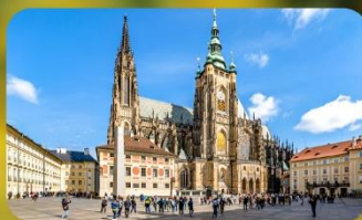
เข้าชม 2 ปราสาท ปราก และเซินบรุนน์