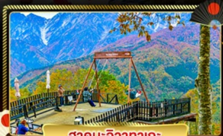
ฮาคุบะ-อิซากาตะ