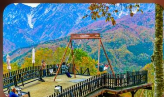
ฮาคุบะอิวาทากะ