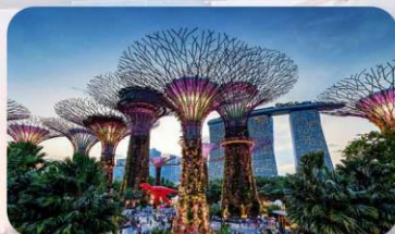
Gardens by the Bay