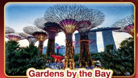
Gardens by the Bay