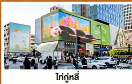
ไถ่กูหลี่