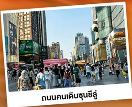
ถนนคนเดินชุนชี่อู่