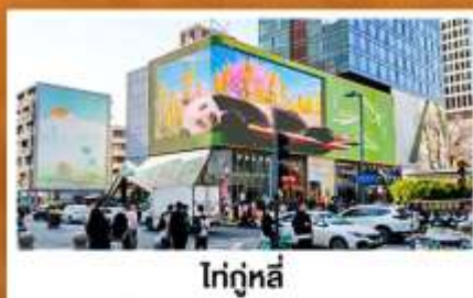
ไท่กู๋หลี่