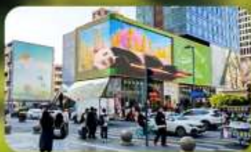
ไท่กุ๋หลี่