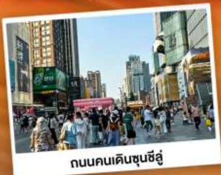
ถนนคนเดินชุนชี่อู่

"สวีตเซอร์แคนด์เนียง" แคนมังกร แหล่งท่องเที่ยวทางธรรมชาติระดับ 4A