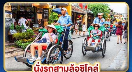
นั่งรถสามล้อฮิโคล่