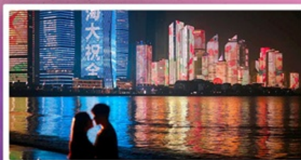
ชายหาดหมายเลข 3