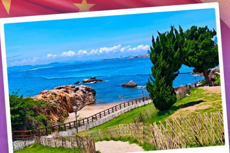
เกาะเสี่ยวมายเต่า

เที่ยวชิงเต่า เมืองทะเลสุดชิล ครบทั้งกิน เที่ยว ถ่ายรูป