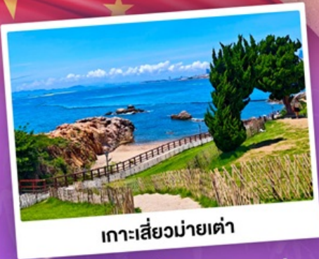
เกาะเสี่ยวมายเต่า

เที่ยวชิงเต่า เมืองทะเลสุดชิล ครบทั้งกิน เที่ยว ถ่ายรูป