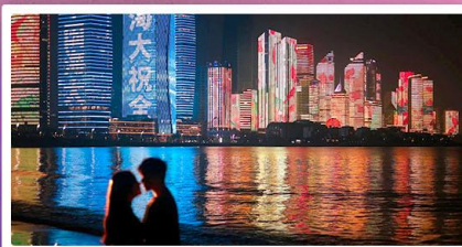
ชายหาดหมายเลข 3