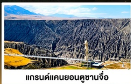
แกรนด์แคนยอนดูซานจื่อ