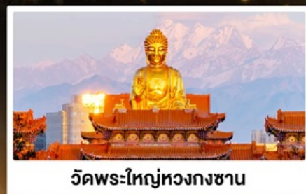
วัดพระใหญ่หวงกงซาน