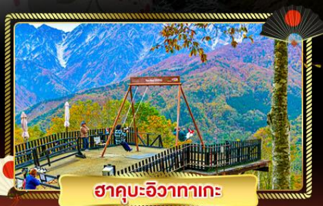
ฮาคุบะฮิวาตากะ