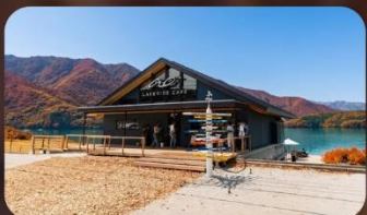
AO Lakeside Cafe'