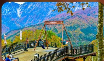
ฮาคุบะอิวัตทาเกะ