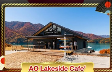
AO Lakeside Cafe'