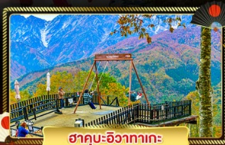
ฮาคุบะ-อิซากาตะ