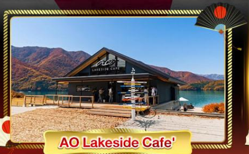
AO Lakeside Cafe'