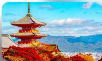
วัดคิโยมิชิ