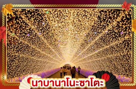
นาคานาโนะซาโตะ