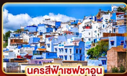
นครสีฟ้าเซฟซาอูน

📅เดินทาง: 18-27 ต.ค. | 02-11 ส.ค. 69 27 ส.ค. 69 - 05 ม.ค. 70