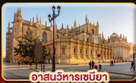
อาสนวิหารเซบิยา