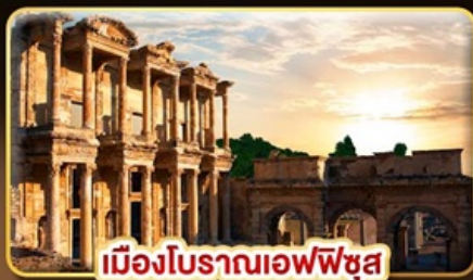
เมืองโบราณเอเฟซุส