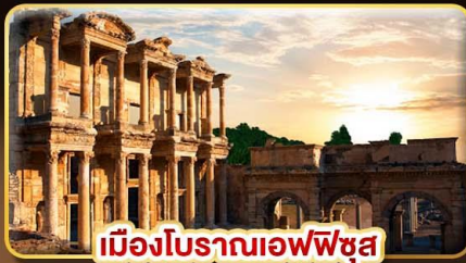
เมืองโบราณเอฟเฟซุส