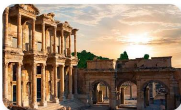
เมืองโบราณเอเฟซุส