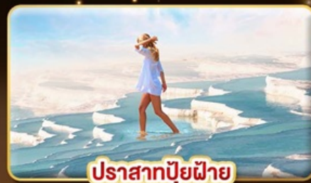
ปราสาทบูยฝาย