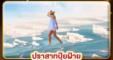
ปราสาทบิวไฟาย