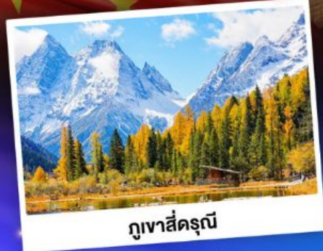
กูเวาสีครุณี

ชมบรรยากาศใบไม้เปลี่ยนสี "สถานที่ท่องเที่ยว 5A อุทยานจิวจ้ายโกว"