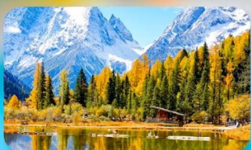
กุเวาสี่ดรุณี