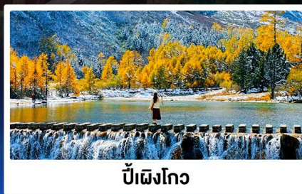
ปี้ฝิงโกว