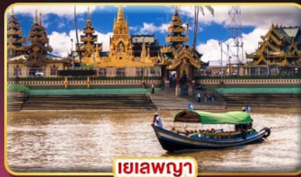
ยี่ลาพญา