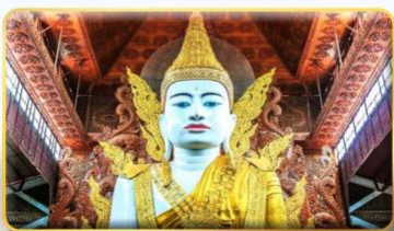
วัดหงาทัดจี