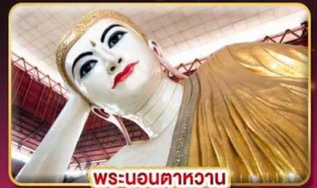
พระนอนตาทวน