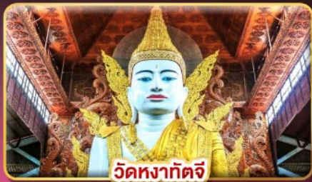
วัดหงาทัดจี

ร่วมเดินทางกับกูรู มูยั้งโงให้ปังกับ แม่หมอมิเซล