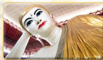
พระนอนตาทาวน์