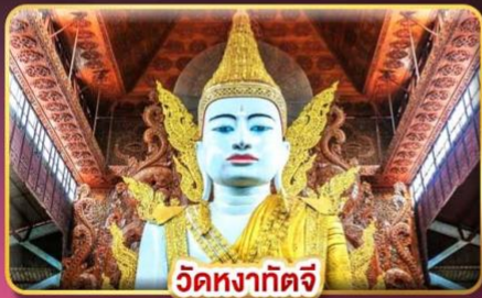
วัดหงส์ทิศจี

ร่วมเดินทางกับกูรู มูยั้งโงให้ปังกับ แม่หมอมิเซล