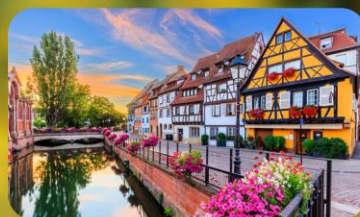
ดินแดนแห่งเทพนิยาย กอลมาร์