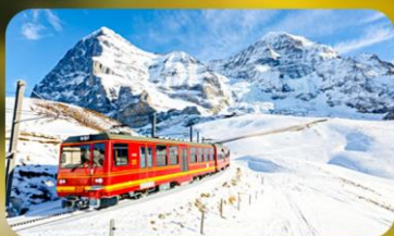
พิชิตยอดเขาจุงเฟรา