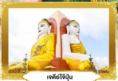
เจดีย์ไจ้ปูน