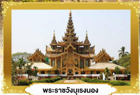
พระราชวังบุเรงนอง