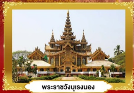
พระราชวังบุเรงนอง

ย่างกุ้ง • หงสาวดี • อินทร์แวงน | 3 วัน 2 คืน