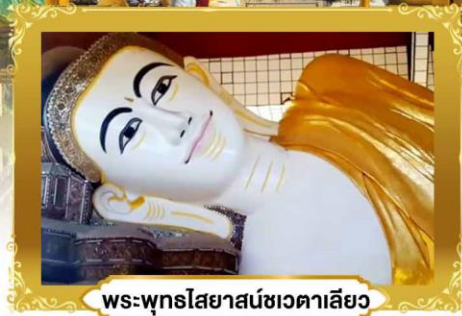
พระพุทธรูปไสยาสน์ชเวตาเลียว