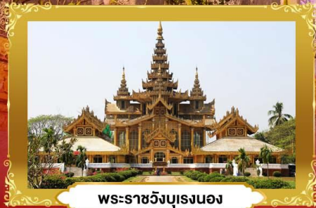
พระราชวังบุเรงนอง

ย่างกุ้ง • หงสาวดี • อินทร์แวง | 3 วัน 2 คืน