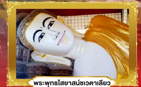
พระพุทธรูปไสยาสน์ชเวดากอง