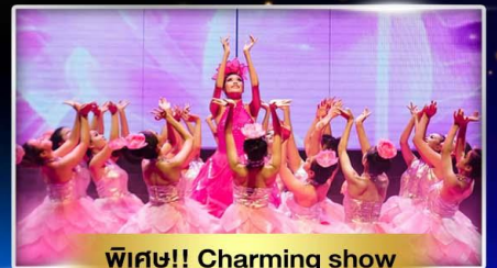
พิเศษ!! Charming show