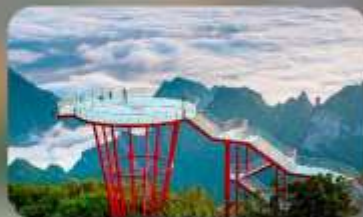
ภูเขา 7 ดาว