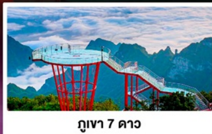
ภูเขา 7 ดาว