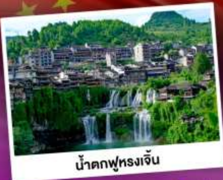
น้ำตกฟูหลงเจิ่น

เที่ยวชมหมู่บ้านโบราณริมน้ำตก "ฟูหลงเจิ่น" นั่งกระเช้าขึ้นสู่อุทยาน กูเขาเจ็ดดาว