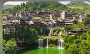
หมู่บ้านโบราณฟุทงเจิน