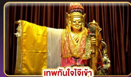
เทพทันใจโจ้เข้า