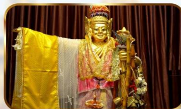
เทพทันใจโจ้เข้า