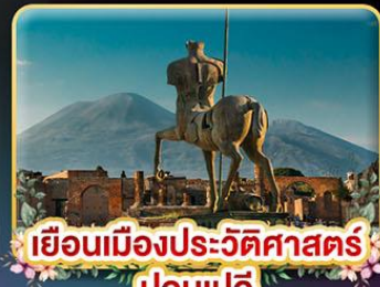
เยือนเมืองประวัติศาสตร์ ปอมเปอี