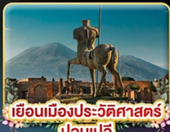
เยือนเมืองประวัติศาสตร์ ปอมเปอี