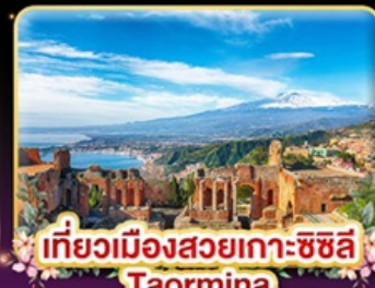
เที่ยวเมืองสวยเกาะซิซิลี Taormina