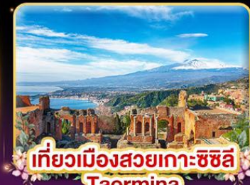
เที่ยวเมืองสวยเกาะซิซิลี Taormina