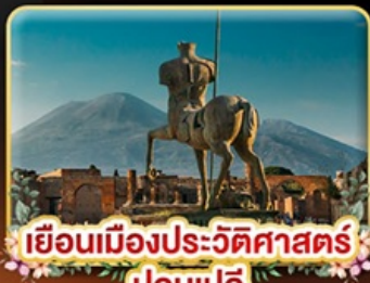
เยือนเมืองประวัติศาสตร์ ปอมเปอี