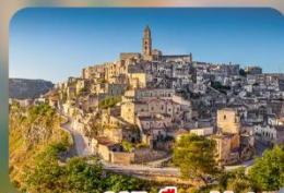
ตามรอย 007 เมือง Matera