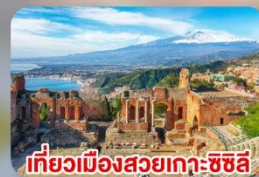
เที่ยวเมืองสวยเกาะซิซิลี Taormina