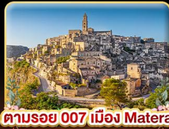
ตามรอย 007 เมือง Matera