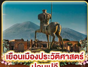
เยือนเมืองประวัติศาสตร์ ปอมเปอี