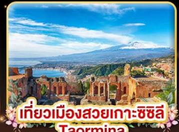
เที่ยวเมืองสวยเกาะซิซิลี Taormina