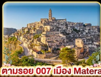
ตามรอย 007 เมือง Matera