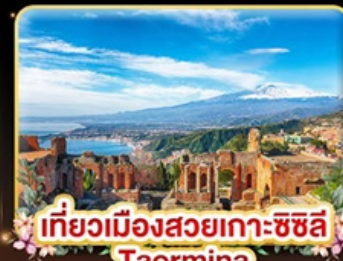
เที่ยวเมืองสวยเกาะซิซิลี Taormina