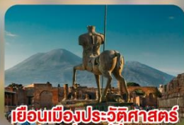
เยือนเมืองประวัติศาสตร์ ปอมเปอี