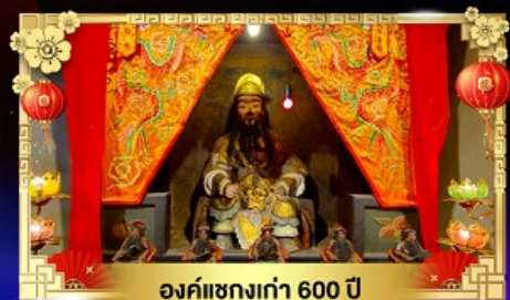
องค์แซงเก่า 600 ปี