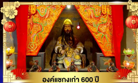
องค์แซกงเก่า 600 ปี